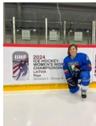
Mazzocchi Marta 2024 IIHF ICE HOCKEY WOMEN'S WORLD CHAMPIONSHIP - LATVIA, Riga