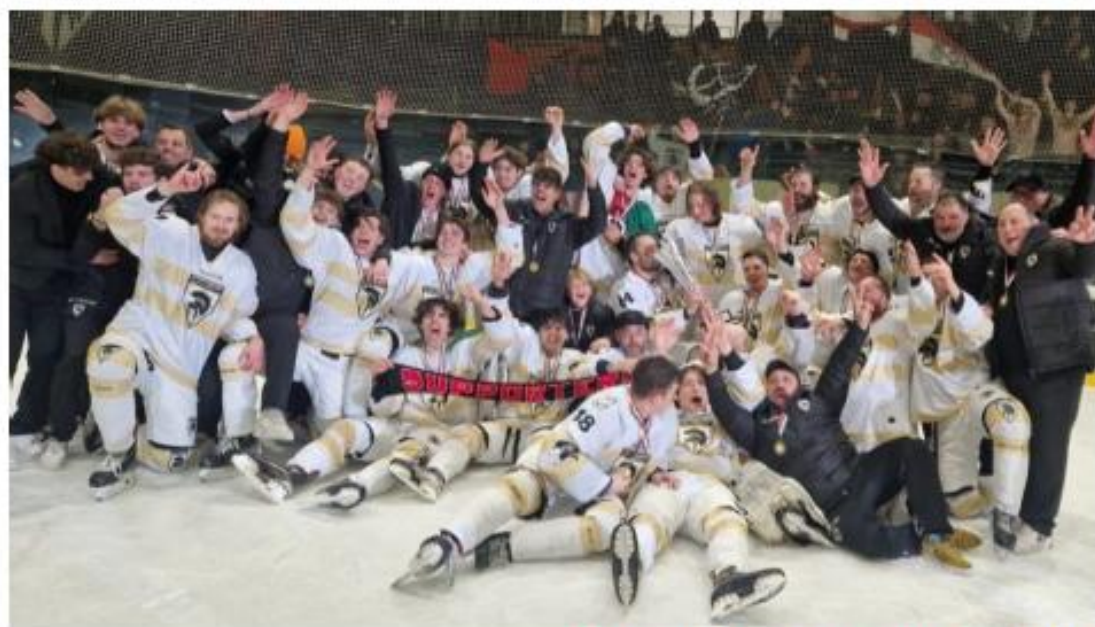
SCUDETTO IHL DIV.1 stagione 2023/2024 e promozione in IHL