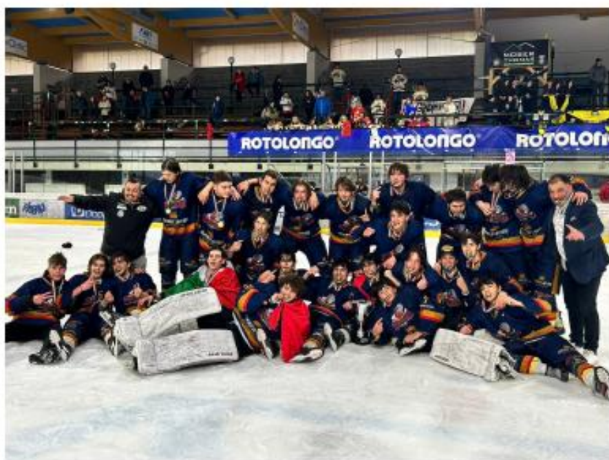
SCUDETTO UNDER 17 stagione 2022/2023